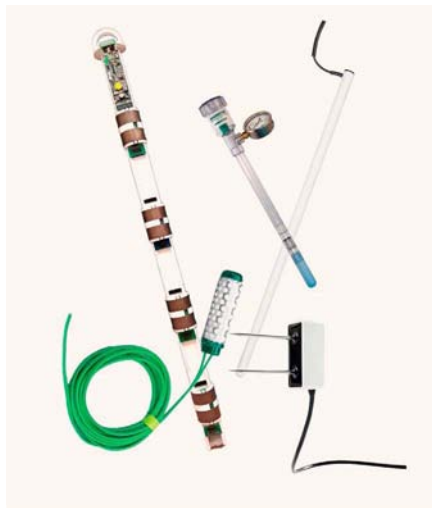
Imagen 3. Batería de tensiómetros para control del riego en pimiento (Pilar de la Horadada).