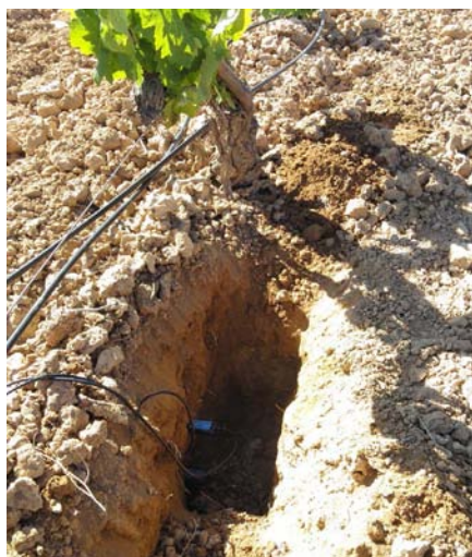
Imagen 6. Sonda multisensor compacta en granado (Museros).