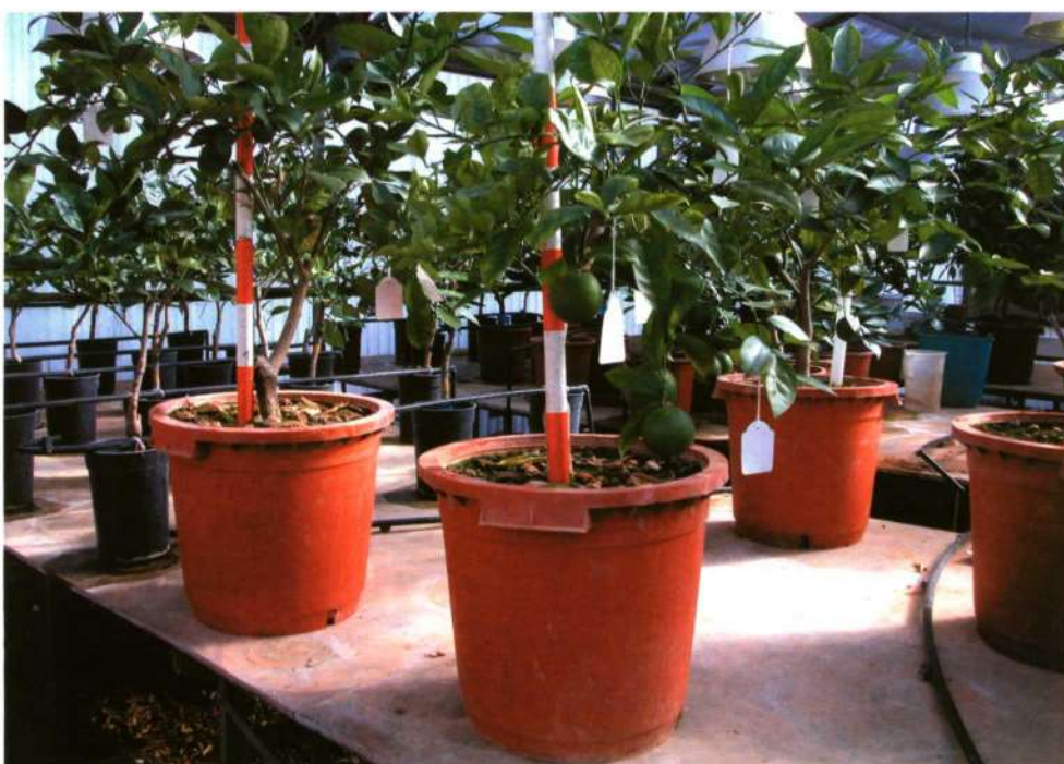
El estudio se llevó a cabo en veinte plantones de naranja Valencia Late de tres años, cultivados en contenedores de 25 l con suelo muy calizo.

El estudio se llevó a cabo en veinte plantones de naranjo Valencia Late ( Citrus sinensis (L.) Osbeck) sobre citrange Carrizo ( Citrus sinensis x Poncirus trifoliata ), de tres años, cultivados en contenedores de 25 l de capacidad, con un suelo muy calizo (69% de carbonatos totales y un 30% en calcio activo), en condiciones controladas de invernadero y con riego por goteo. Se efectuaron cuatro tratamientos con cuatro repeticiones de una planta: dos dosis diferenciales de Greental y dos de Vanguard. Como control se usaron cuatro plantas no tratadas ( cuadro I ). Las dosis de micronutrientes se establecieron de acuerdo con Legaz y Primo-Millo (2000). Bañuls et al. (2003a) encontraron la mayor acumulación de Fe foliar con la aplicación mensual de Greental en Clementina de Nules sobre citrange Carrizo, al aplicar el Fe a intervalos de una, dos, cuatro y ocho semanas en riego a goteo. En función de este estudio, las dosis se aplicaron en tres fracciones iguales: floración (abril), cuajado (mayo) y crecimiento del fruto (julio).