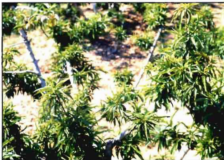
Vegetación en rosetas, entrenudos cortos y reducción de vigor causada por cepas agresivas del virus del enanismo del ciruelo (PDV) en melocotonero.

Los virus más habituales (virus IIar y ACLSV) pueden ser fácilmente controlados mediante el uso de material sano, certificado o no, pero producido en viveros con un adecuado control. En la actualidad los medios y sistemas técnicos para efectuar el control de enfermedades y los oportunos diagnósticos y detecciones son de tal fiabilidad, que es inexcusable su desconocimiento y la no realización de análisis. ■