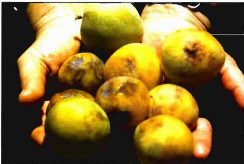
Síntomas causados por el virus de la sharka en frutos de ciruelo japonés. Var. Golden Japan.

El PDV afecta especialmente a cerezo, melocotonero, ciruelo europeo y almendro, aunque puede infectar al albaricoquero y al ciruelo japonés y mirabolano. La reducción del vigor o crecimiento suele ser muy acusada. Se han descrito diferentes enfermedades causadas por PDV: el enanismo del ciruelo ("prune dwarf") en la que el virus reduce la longitud de los entrenudos, las hojas son pequeñas y aparecen brotes defoliados; la amarillez del guindo o cerezo ácido ("sour cherry yellows")