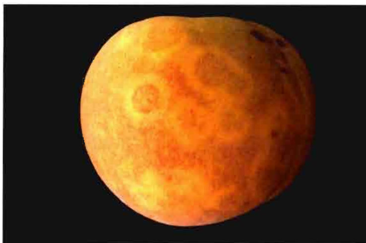
Anillos cloróticos en la superficie de frutos de melocotón "Spring Crest" causado por el virus de la sharka (PPV-D o común).