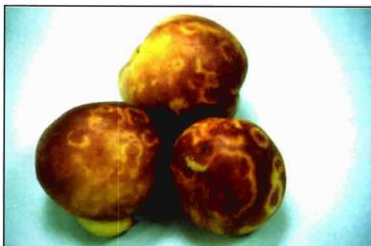
Síntomas causados por el virus de la sharka M en frutos de nectarino.

algunos aislados del virus del enanismo del ciruelo (PDV) y el ToRSV. Todos están presentes en España con la excepción del último de ellos que todavía no ha sido descrito en nuestro país aunque está muy extendido en América del norte y del sur.