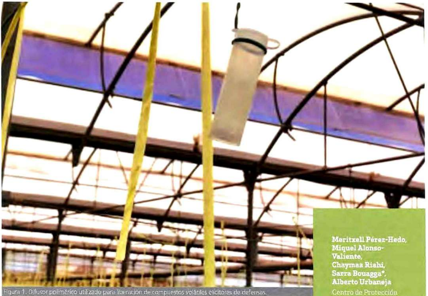
Figura 1. Difusor polimérico utilizado para liberación de compuestos volátiles elicitores de defensas.