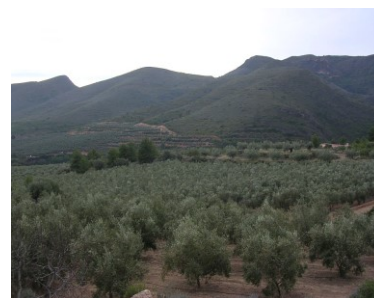
Plantación de Picual a 6 x 7 m

Las dotaciones de riego anuales para un olivar adulto dependen de variables ambientales locales, de la densidad de plantación, de la reserva de agua en el suelo, de la variedad, del tipo de manejo del árbol. Pueden ser en torno a 2.500 m 3 /ha, pero ya a partir de 500 m 3 /ha se consiguen considerables aumentos de producción. (Para consultar las necesidades de riego de su olivar , pinche sobre el texto en azul, elija el nombre de la localidad y cultivo de olivo).