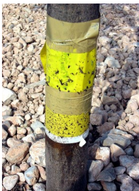
Adhesivo control otorrinco