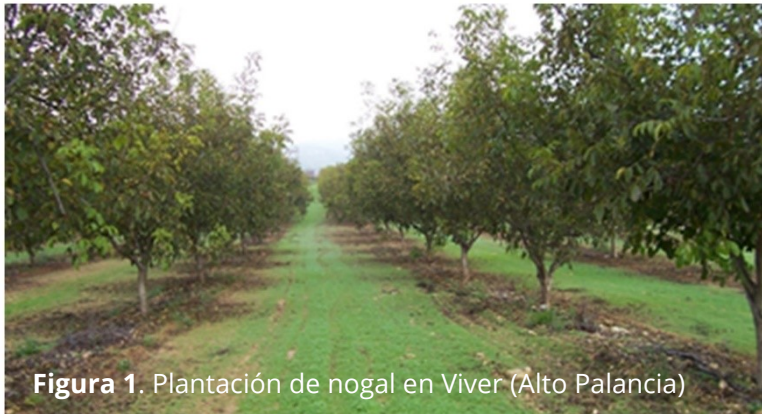
Figura 1. Plantación de nogal en Viver (Alto Palancia)

El nogal ( Juglans regia ) es un frutal caducifolio de la familia de las Juglandáceas. Su fruto seco, la nuez, es un alimento probiótico por su alto contenido en ácidos grasos poliinsaturados, antioxidantes, vitaminas (sobretudo B) y minerales (oligoelementos). Su consumo tiene muchas propiedades saludables: reduce el LDL-colesterol y aumenta el HDL-colesterol, reduce el estrés (reduce la proteína C-reactiva), aumenta la lucidez mental, la fertilidad masculina, la protección del colon y produce un efecto saciante sin provocar obesidad.