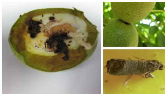
Figura 5. ‘Carpocapsa’. Daños causados en el fruto (izquierda), orificio de entrada de la larva en el fruto (superior-derecha) y, adulto (inferior-derecha).

10.1. Plagas. La plaga clave es la ‘Carpocapsa’ o ‘Agusanado de la nuez’ ( Cydia pomonella ), lepidóptero de hábitos