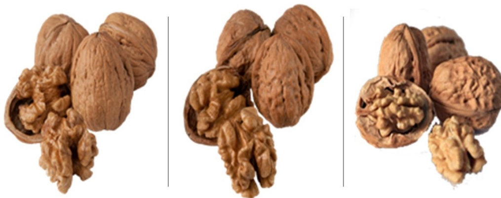
Figura 3. Variedades de nogal: Chandler (izquierda), Serr (centro) y Fernor (derecha).

Variedades españolas. Son variedades locales, poco productivas, con frutos de bajo calibre, pero muy buen sabor. Ocupan plantaciones antiguas las variedades Alcalde , Carcaixent , Cerdá , Escrivá , Ibi , Ontinyent , Utiel , Villena , etc.