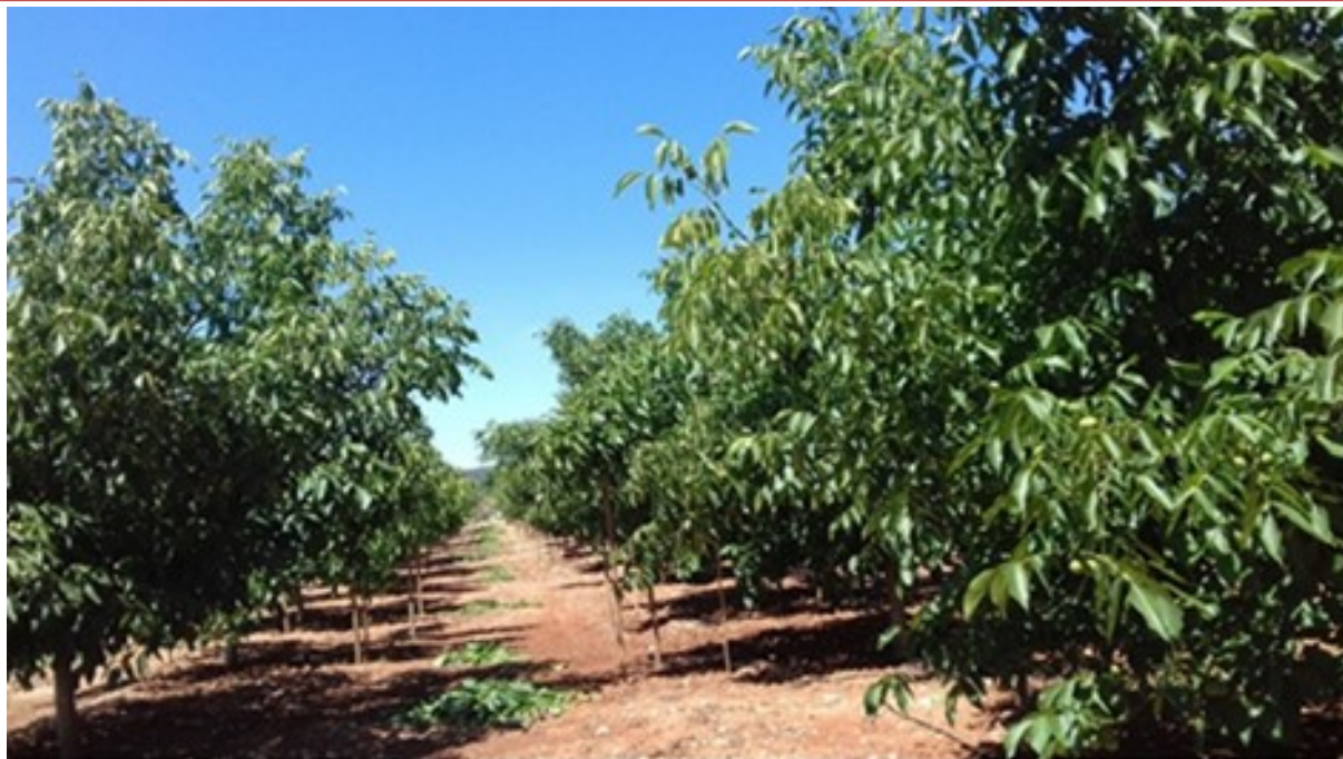
Figura 4. Poda en verde del nogal a primeros de junio en Enguera (La Canal de Navarrés).