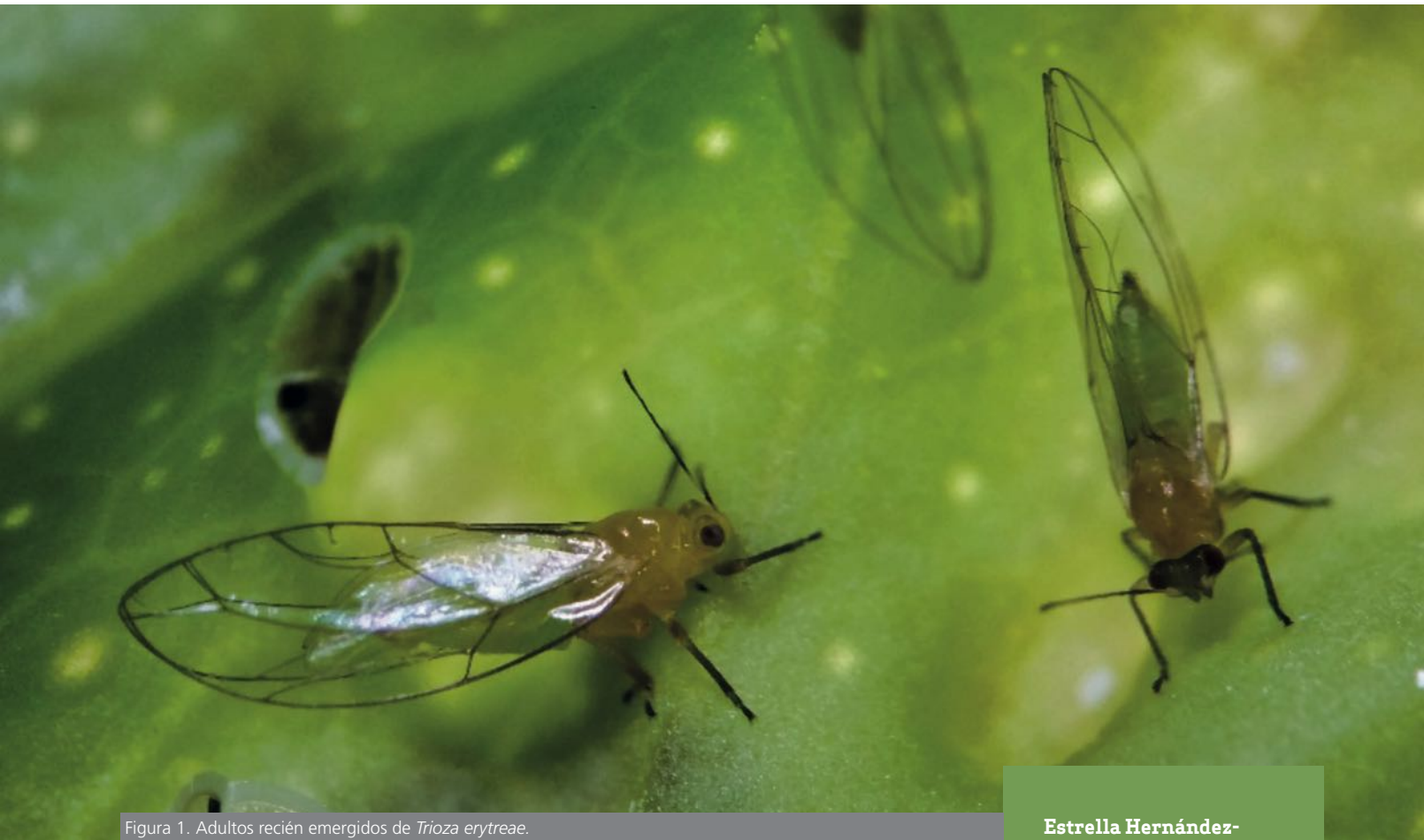
Figura 1. Adultos recién emergidos de Trioza erytreae .