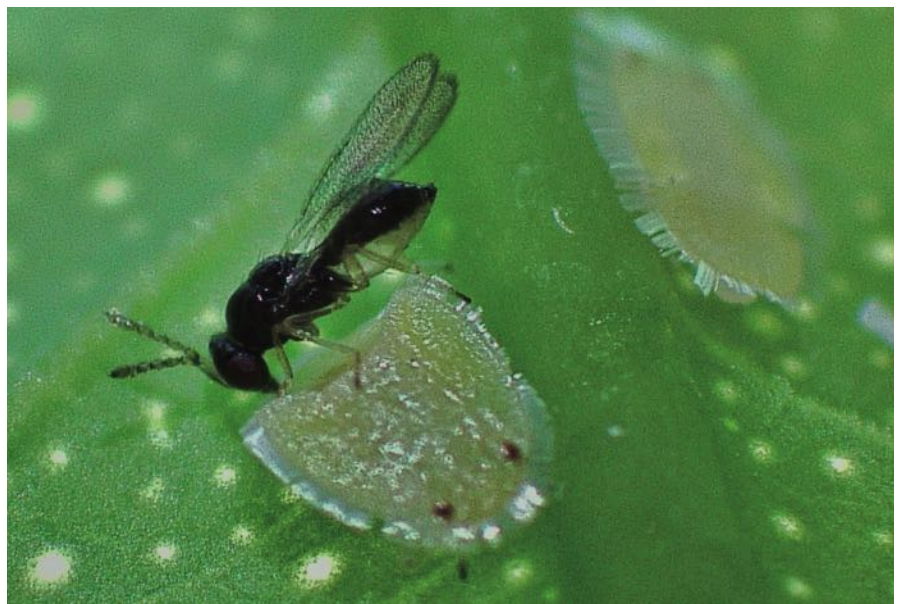
Figura 3. Ninfas de Trioza erythrae parasitadas por Tamarixia dryi .

Para estudiar la dispersión de T. dryi en las Islas Canarias, la Consejería de Agricultura, Ganadería y Pesca del Gobierno de Canarias, a través de la encomienda que ejecuta la empresa Gestión del Medio Rural de Canarias (GMR), muestrearon un total de 257 parcelas de cítricos entre 2018 y 2019. Las parcelas se seleccionaron en las principales zonas productoras de cítricos, con una representación altitudinal de los cultivos y de las vertientes norte y sur de las islas. En cada parcela, se recogieron doce brotes, preferiblemente infestados con ninfas de T. erythrae . Los brotes se conservaron en bolsas de plástico con papel secamos para evitar la condensación. Cada bolsa se etiquetó con el código de la parcela y la fecha de recolección. Una vez en laboratorio, se contabilizó el número de ninfas del psílido y