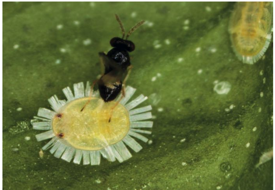
Figura 2. Adulto de Tamarixia dryi parasitando a una ninfa de Trioza erytreae .

Los principales vectores del HLB son los psíidos Diaphorina citri Kuwamura (Hemiptera: Liviidae) y Trioza erytreae (Del Guercio) (Hemiptera: Triozidae (Bove, 2006) (Figura 1). Ambos psíidos se alimentan y desarrollan sobre plantas de la familia de las rutáceas a la que pertenecen los cítricos. Mientras D. citri , que es de origen asiático, se ha dispersado por toda Asia, América y el nordeste de África, T. erytreae ha permanecido en el África subsahariana y sus islas colindantes hasta que se detectó en Madeira y las Islas Canarias en 1994 y 2002, respectivamente (Cocuzza y col., 2017). Posteriormente, T. erytreae se detectó en el otoño de 2014 en Galicia y en el norte de Portugal en 2015, desde donde se dispersó hasta alcanzar la zona de Lisboa (Pérez-Otero y col., 2015; DGVA, 2019). A pesar de que todos los estudios realizados hasta la fecha muestran que T. erytreae está libre de la enfermedad tanto en la península ibérica como en las Islas Canarias (Siverio y col., 2017), la presencia de este psíido es la mayor amenaza para los cítricos españoles porque el vector puede movilizar Candidatus Liberibacter spp. desde rutáceas portadoras que puedan estar ya en España o que puedan entrar a partir de ahora. Por todo ello, es necesario impedir la llegada de T. erytreae a las principales zonas cítricas españolas. La introducción de un ene-