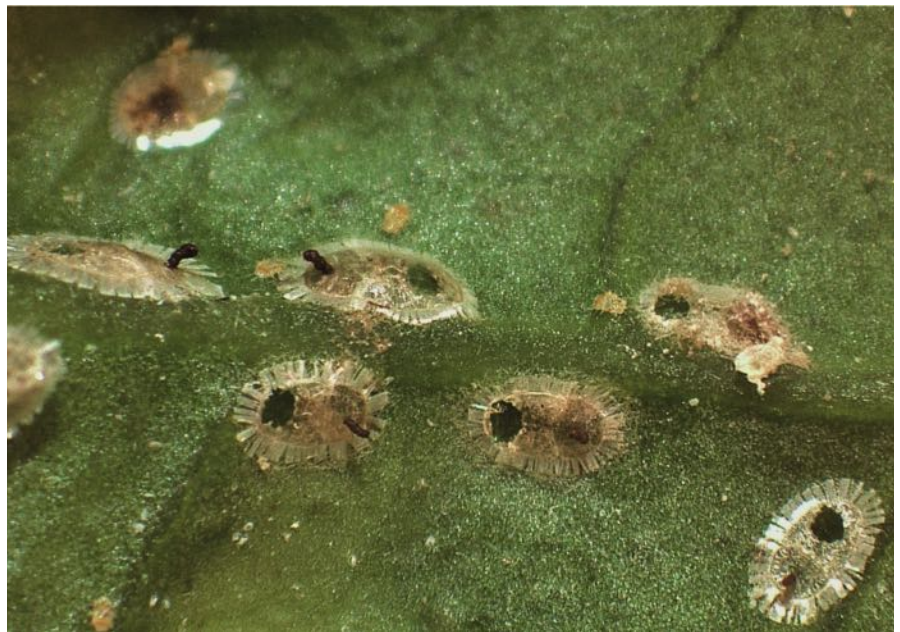
Figura 4. Hembra de Tamarixia dryi alimentándose de Trioza erythrae .

si mostraban signos de parasitismo. Una vez observados los brotes, estos se colocaron en evolucionarios que se revisaron diariamente para recoger los individuos de T. erythrae y T. dryi . Estos muestreos permitieron establecer la presencia tanto del psílido como la dispersión del parasitoide.