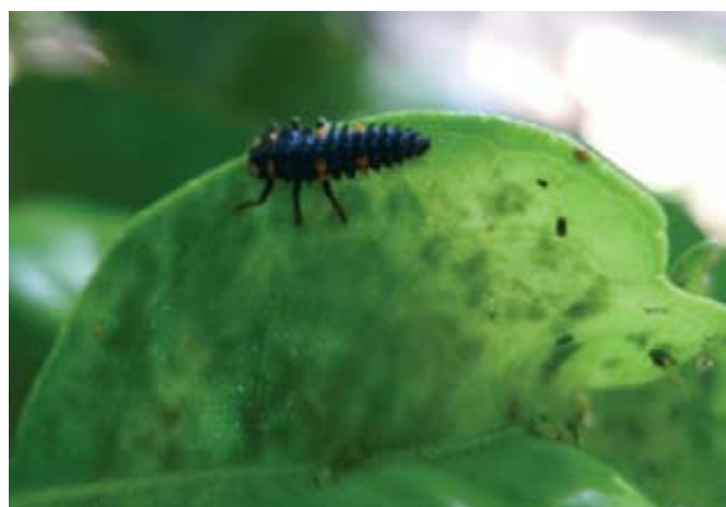
Foto 4. Larva de Coccinella septempunctata en una colonia de A. spiraecola .

Los depredadores actúan de manera inmediata sobre las colonias. Algunas formas adultas, pero sobre todo las formas larvianas, son las que se alimentan de pulgones, como por ejemplo los Chrysopidae Chrysoperla carnea (Stephen) y Chrysopa pallens (Rambur) (fotos 2 y 3). Dentro del orden de los Coleoptera, los Coccinellidae , tanto el adulto como las formas larvianas, presentan hábitos depredadores (fotos 4, 5 y 6). Las especies más importantes pertenecen a géneros como Scymnus spp. (sobre todo Scymnus interruptus (Goeze), Scymnus subvillosus (Goeze) y Propylea quatuordecimpunctata (L.) (foto 5) (Belliere, 2002; Alvis et al. , 2002; Sastre-Vega, 2007), pero también otros más conocidos comercialmente como Coccinella septempunctata (L.)