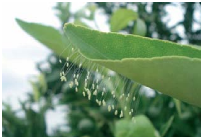
Foto 2. Puesta de Chrysopa pallens (= septempunctata ) sobre hoja de clementino.

Toxoptera aurantii está estrechamente relacionado a los cítricos, aunque no es exclusivo. Antes de la introducción de A. spiraecola (Her-