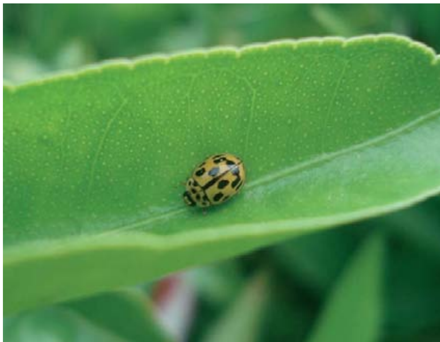
Foto 5. Adulto de Propylea quatuordecimpunctata sobre hoja de clementino.

(foto 4) y Adalia bipunctata (L). En cambio en el orden Diptera, tanto Syrphidae como Cecidomyiidae depredan solo en estado juvenil (foto 6).