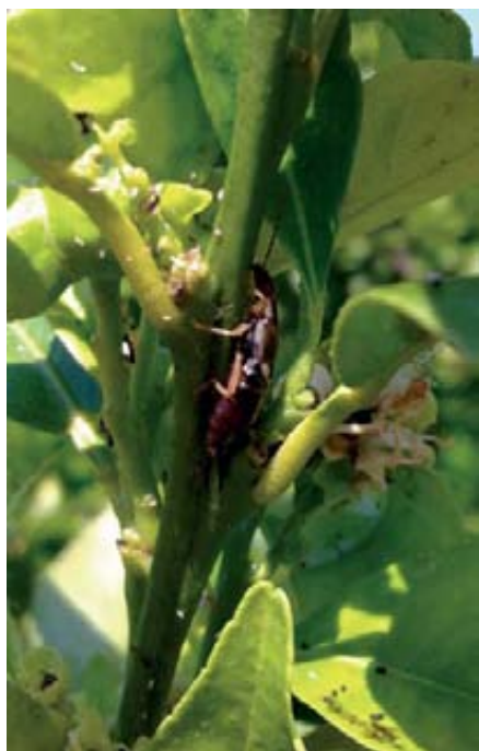
Foto 1. Dermáptero alimentándose en una colonia de A. spiraecola .

toxam, además del dimetoato que solo se debe aplicar en plantones, y algunas formulaciones autorizadas pueden aplicarse en árboles en producción hasta la floración, siempre sin cosecha pendiente de recolectar (Boletín de Avisos GVA, 2012). Cada uno de estos insecticidas posee unas cualidades diferentes, que aconsejan su uso en tratamientos de choque o preventivos, optimizando su uso y aplicación. Cuando la presencia de melaza es abundante, se deberá dar primero un tratamiento para lavar y disolver dicha melaza con detergente. Desde el punto de