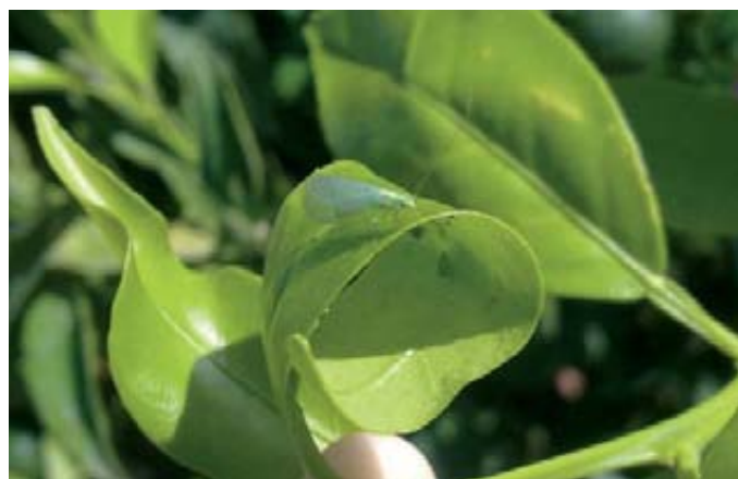
Foto 3. Adulto de Chrysoperla carnea sobre hoja de clementino enrollada por la presencia de A. spiraecola .