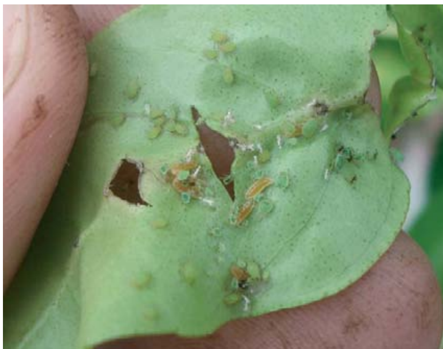
Foto 6: Larvas de Aphidoletes aphidimyza depredando en una colonia de A. spiraeicola .

El establecimiento de estas especies de pulgones en las cubiertas de F. arundinacea a finales de invierno y principios de la primavera pue-