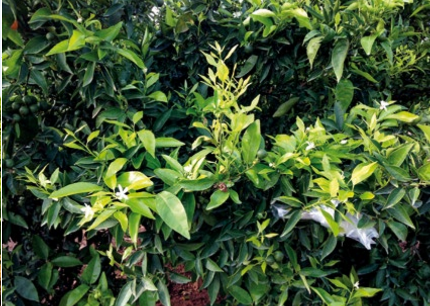
Foto 1. Primera aplicación foliar de los tratamientos (final de junio de 2014).