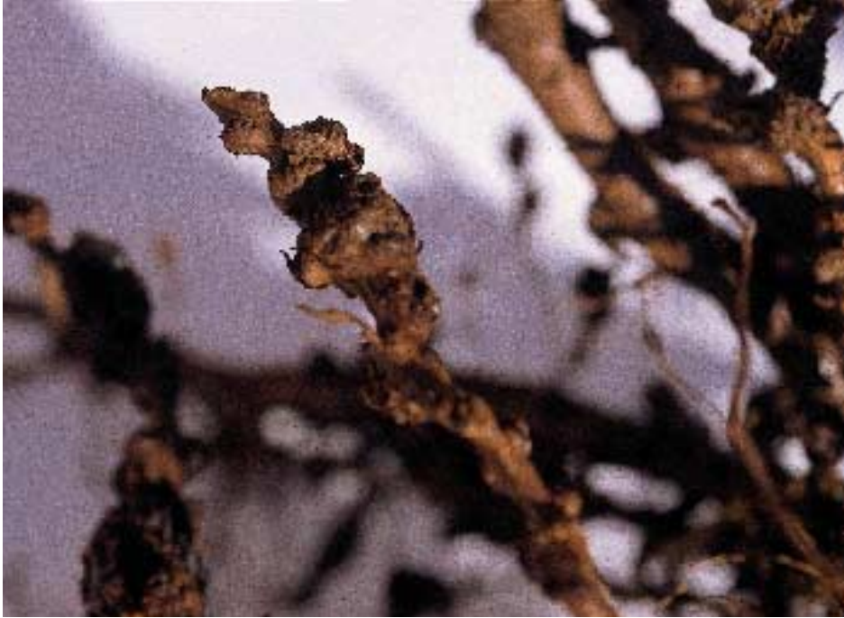
Foto 3. Engrosamiento de las raíces y pérdida de barbada en raíces secundarias. Patrón GF677.

resistentes a nematodos, en los mismos se han incluido bloques de pies GF-677 como testigos. Los patrones utilizados son: Cadaman, Barrier, Sirio, GxN 15, GxN 22, Gx N 14, Adafuel y GF-677.