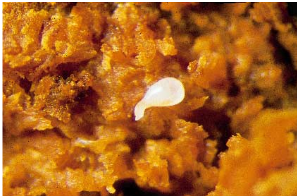
Foto 1. Hembra de Meloydogine.

c) Por la presencia de Nematodos fitoparasitarios que debilitan la planta, ya de por sí en situación de