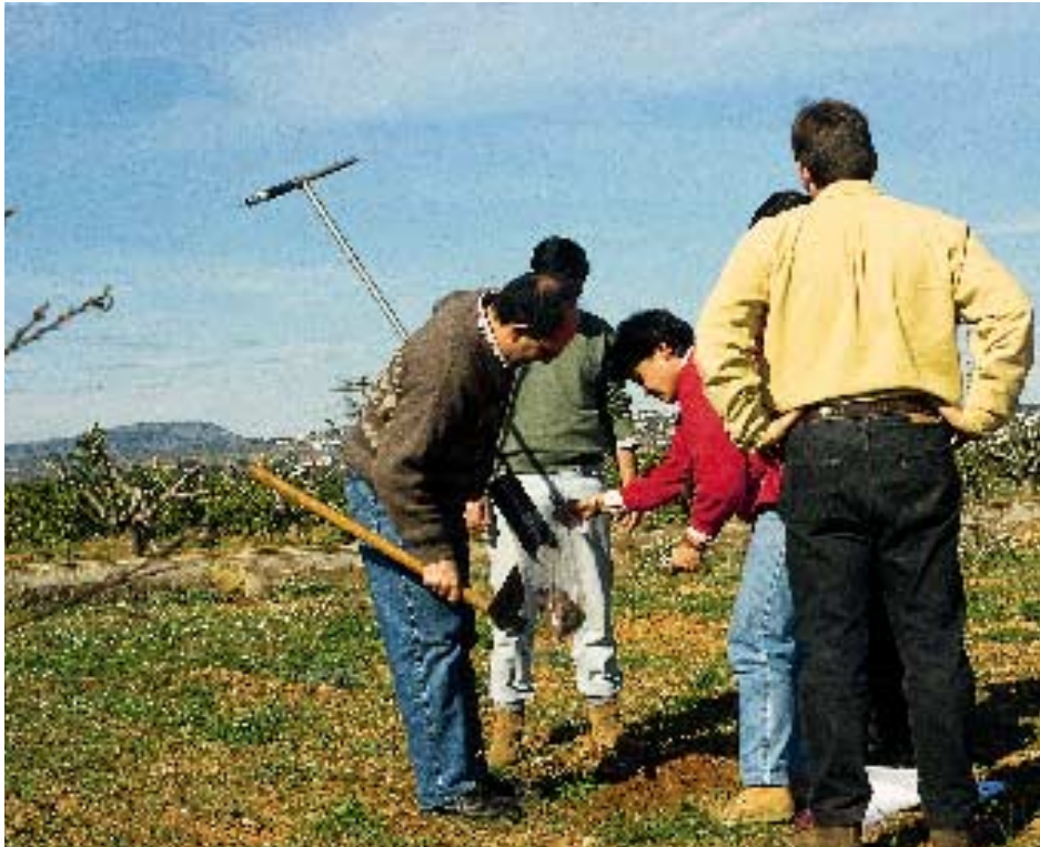
Foto 7. Toma de muestras de suelo después del arranque (febrero 1997) antes de iniciar la experiencia.