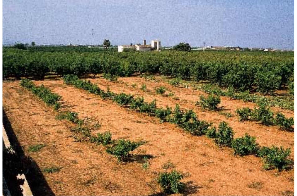
Foto 5. Vista general del campo experimental. En la primera y tercera fila, con plantas con diferentes patrones, se observa la mortandad del GF677. En el centro, el tratado con materia orgánica.