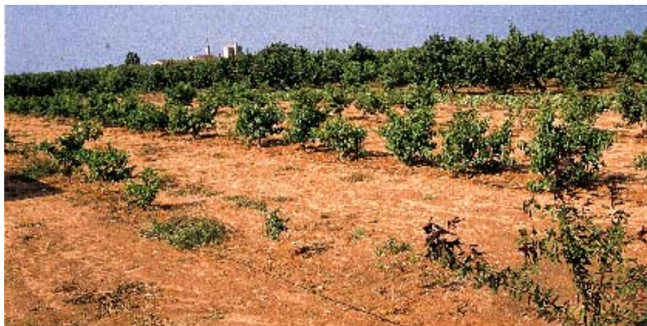
Foto 6. Se observa en primer plano fallos del GF677 y un pie GxN sin injertar con la característica hoja roja. En segundo plano, buen desarrollo, tratado con materia orgánica.

Los resultados se agrupan, según puntuaciones para facilitar la interpretación provisional.