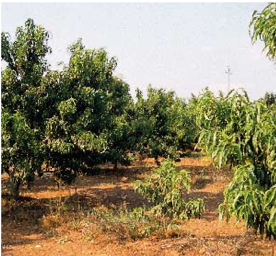
Foto 8. La mortandad de plantas provoca irregularidad en las plantaciones.