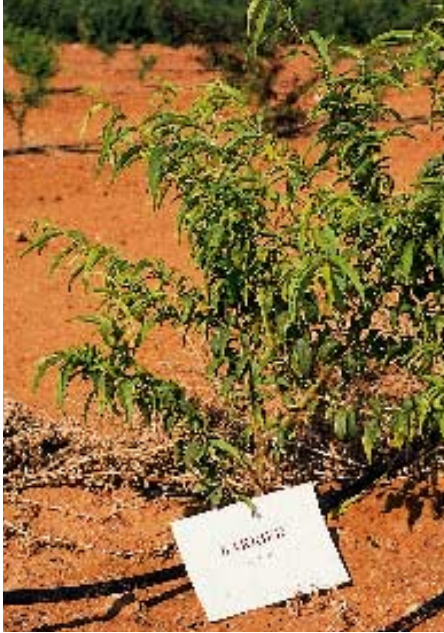
Foto 4. Desarrollo vegetativo y aspecto del patrón Cadaman.