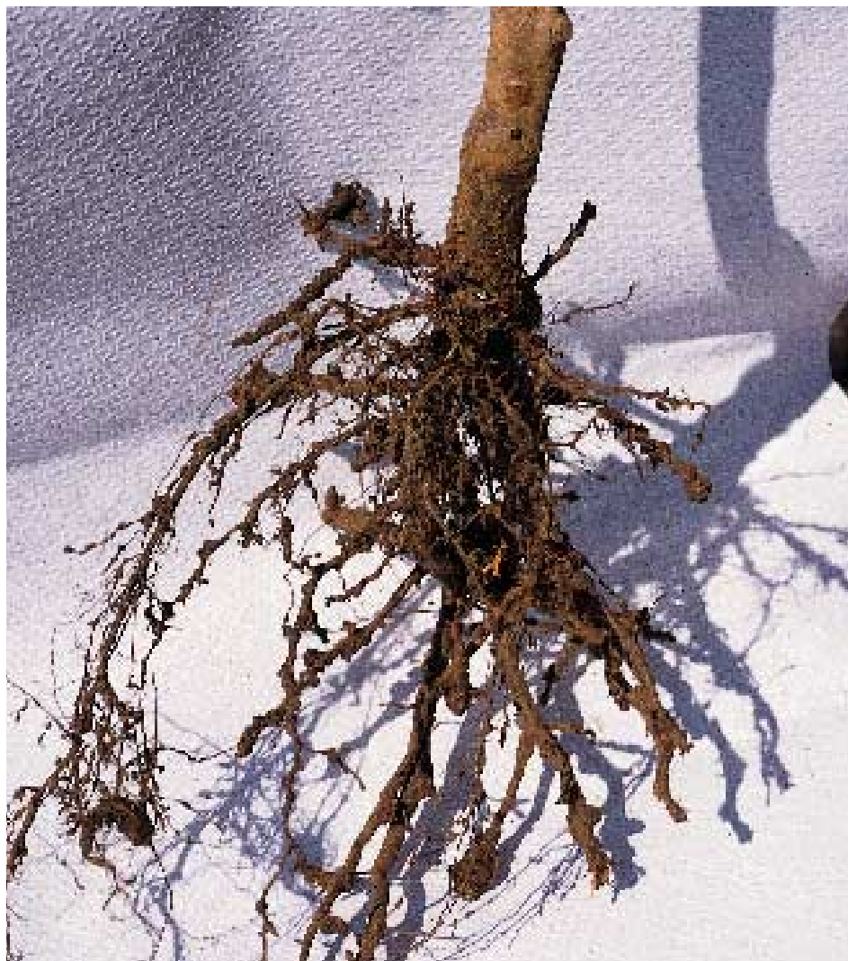
Foto 2. Raíz de GF677 con nódulos causados por nematodos en plánton joven.

El trabajo de campo se desarrolló en los términos de las localidades de Carlet, L'Alcudia, Guadassuar y Alginet, prospectando 50 parcelas de distintas edades, en las que se tomaban muestras de suelo y raicillas, realizando observaciones sobre textura del suelo, síntomas en raíces, mortalidad en plantas, etc., y su determina-