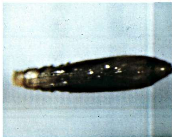
Fig. 4. - Crisálida de P. citrella .