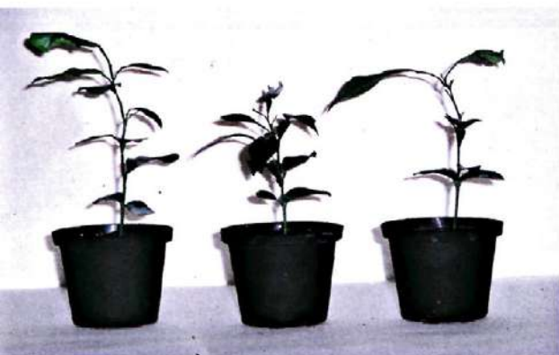
Fig. 1. - Plantas de naranjo amargo de 5-6 meses de edad utilizadas para el estudio del desarrollo del minador.

Para el estudio de la duración y supervivencia del ciclo biológico del insecto se utilizaron plantas de naranjo amargo ( Citrus aurantium L.) de 5-6 meses puestas en macetas de 9 cm de diámetro y 7 cm de altu-