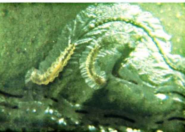
Fig. 3. - Larvas de P. citrella .