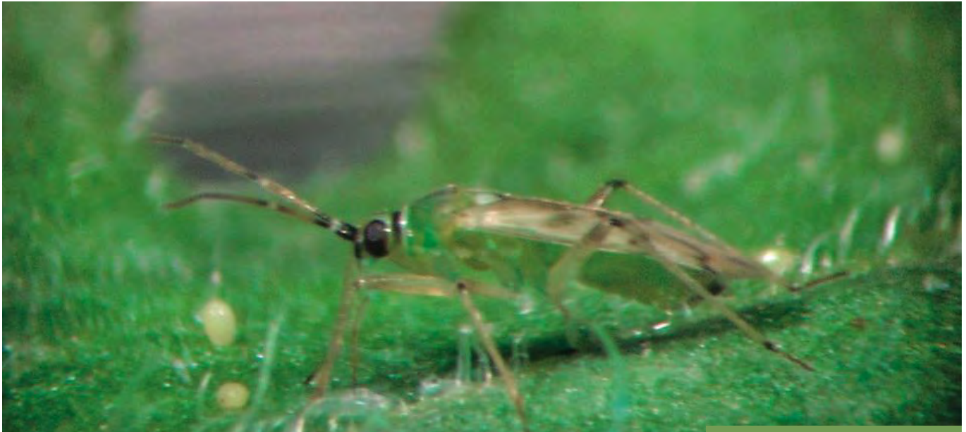
Adulto de Nesidiocoris tenuis .